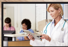
Hospitales o clínicas