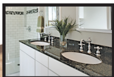
Cuartos de baño